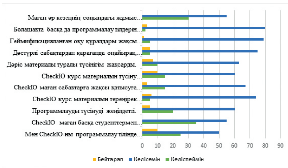
2-сурет. Білім алушылардың жабық сұрақтарға жауаптары

2 суретте білім алушылардың Лайкерт шкаласы бойынша сұрақтарға жауаптары берілген. Келесі жауаптардан тұрады келісемін, бейтарап, келіспеймін. 1-кестеде оларға жауаптармен бірге еркін жауап беретін сұрақтар берілген.