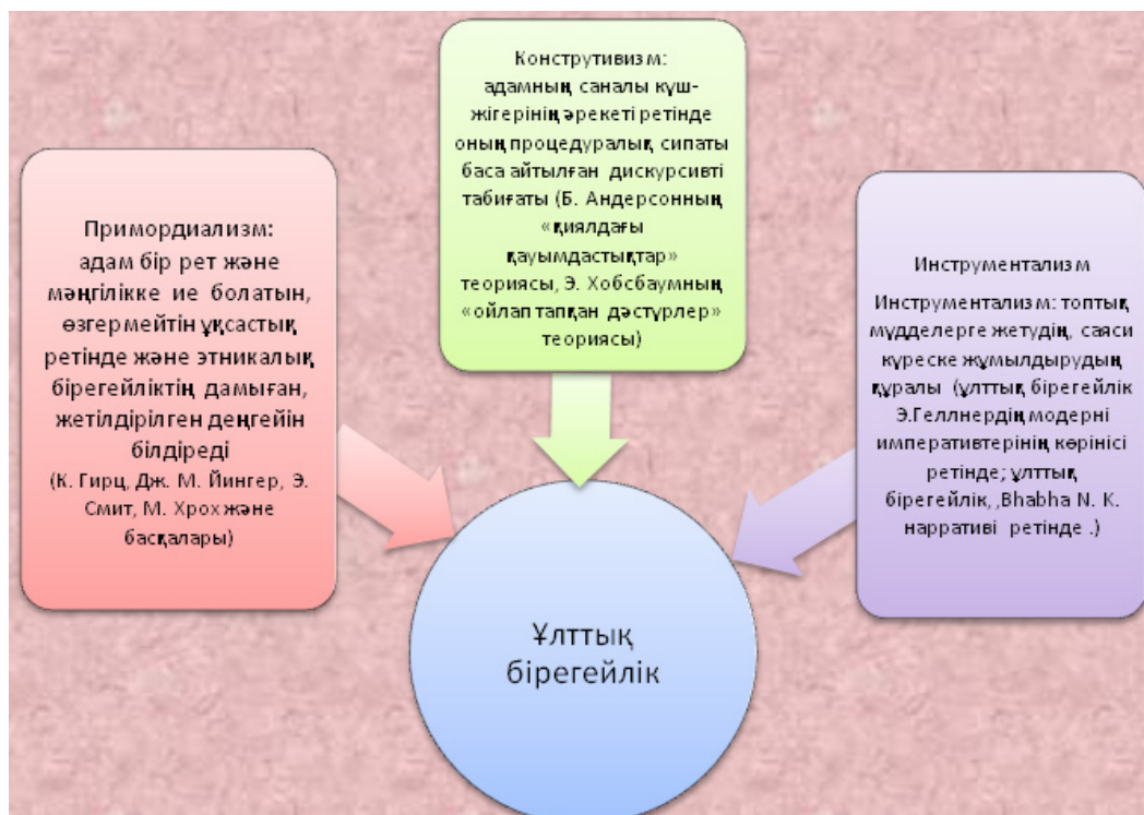
Сурет 2. Ұлттық бірегейлікті дамытудың әдіснамалық әдістері

Біздің жұмысымыздағы ұлттық бірегейлікті, дәлірек айтқанда оның жан-жақты дамуын зерттеудің жетекші әдіснамалық тұрғыдағы ғылыми ізденістер бізді негізгі үш әдіснамалық тәсілге алып келді: примордиализм, конструктивизм, инструментализм (2-сурет)