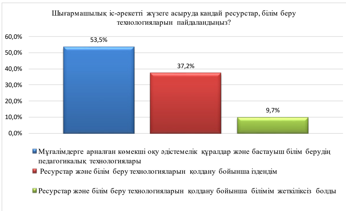
Сурет 3. Шығармашылық іс-әрекетті жүзеге асыруда пайдаланған ресурстар, білім беру техногияларын анықтау

Алынған мәліметтерді бойынша мұғалімдердің шығармашылық іс-әрекетті жүзеге асыруда қажетті ресурстармен қамтамасыз етілгені: мұғалімдердің басым бөлігі өздеріне ең қолайлы және ыңғайлы ресурстарын пайдалану мүмкіндігіне ие болатыны, шығармашылық іс-әрекетті ұйымдастырудың ерекшеліктері мен айырмашылықтарымен танысатынын анықталды.