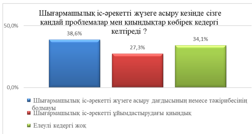
Сурет 5. Шығармашылық іс-әрекетті жүзеге асыру кезіндегі проблемалар мен қиындықтарды анықтау

Сауалнамаға қатысқан мұғалімдердің 34,1%-ы ғана шығармашылық іс-әрекетті жүзеге асыруда елеулі қиындықтарға тап болған жоқ (5-сурет)