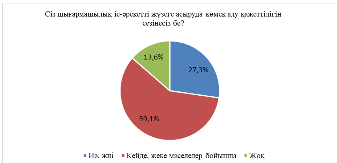
Сурет 4. Шығармашылық іс-әрекетті жүзеге асыруда көмек алу қажеттілігін анықтау

Сауалнамаға қатысқан мұғалімдердің 34,1%-ы ғана шығармашылық іс-әрекетті жүзеге асыруда елеулі қиындықтарға тап болған жоқ (5-сурет)