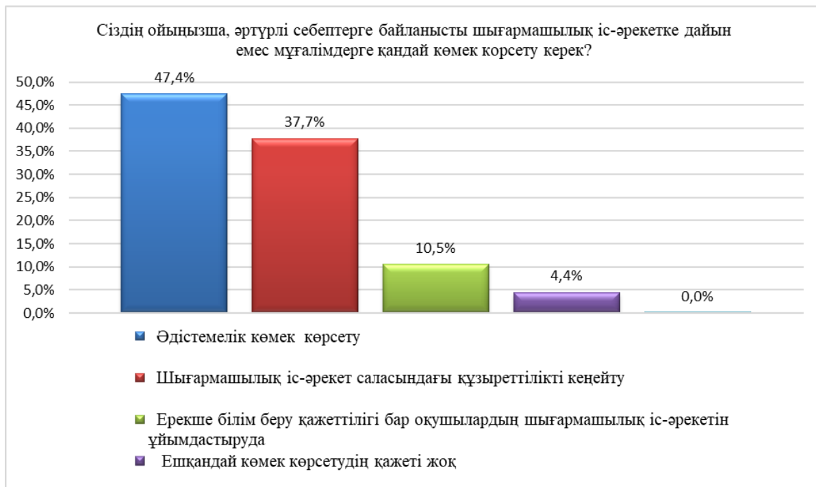
Сурет 7. Әртүрлі себептерге байланысты шығармашылық іс-әрекетке дайын емес мұғалімдерге қажетті көмек