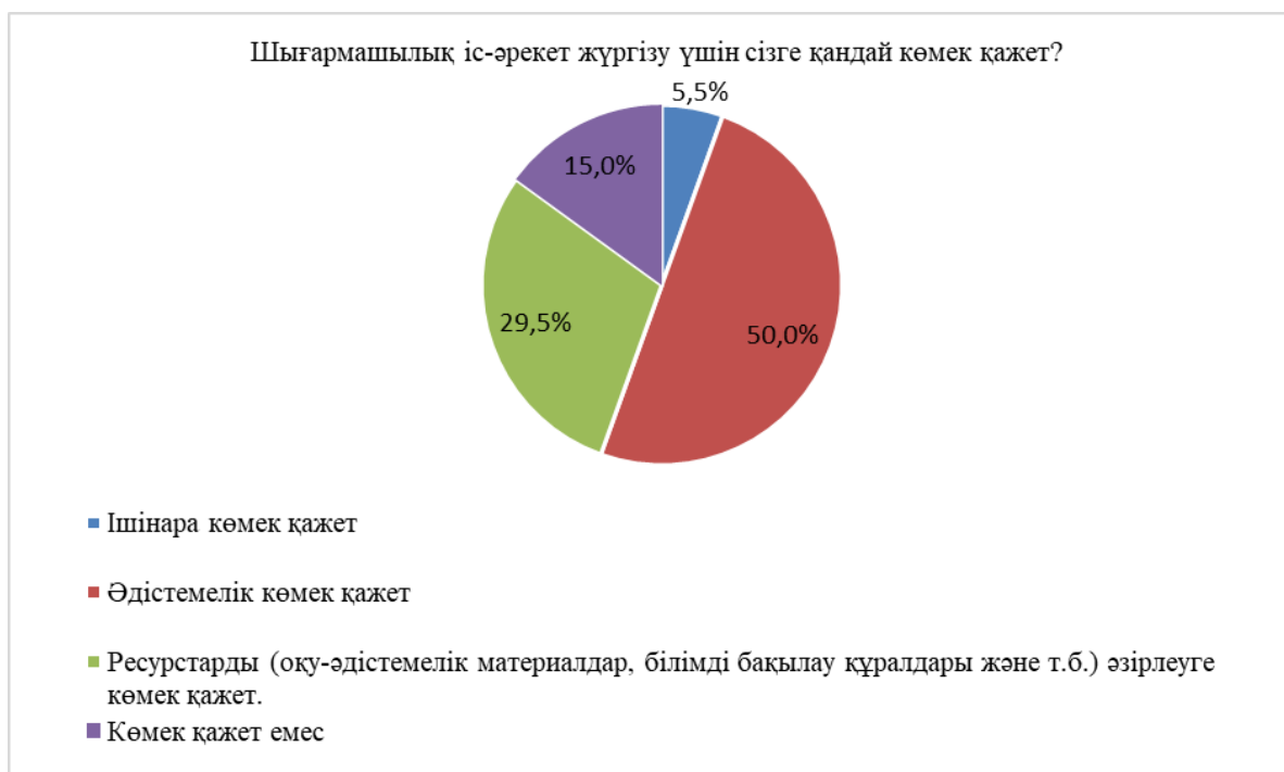
Сурет 6. Шығармашылық іс-әрекетті жүзеге асыру үшін қажетті көмек

Өртүрлі себептерге байланысты шығармашылық іс-әрекетке дайын емес мұғалімдерге қандай көмек қажет ететіндігін анықтау барысында сұралған респонденттердің жауаптары төмендегідей болды (7-сурет):