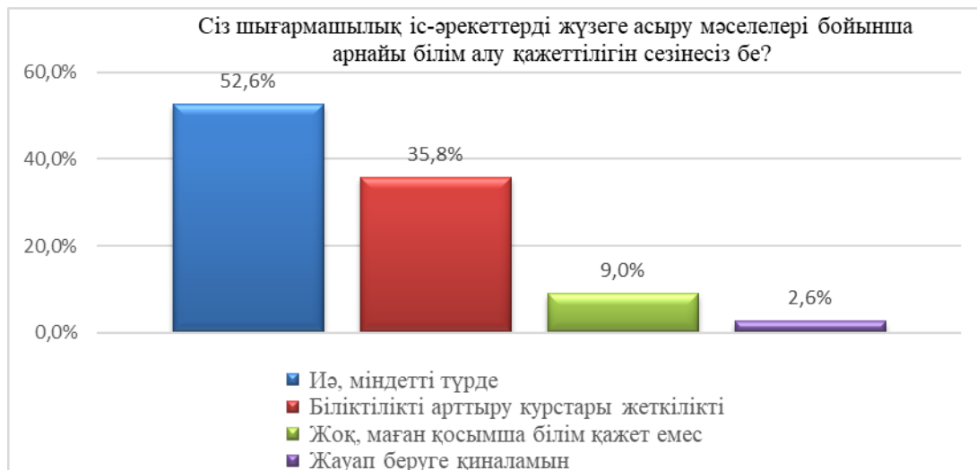
Сурет 8. Шығармашылық іс-әрекетті жүзеге асыру мәселелері бойынша арнайы білім алу қажеттілігін анықтау

«Мұғалімдерді шығармашылық іс-әрекетке даярлау бойынша сіздің пікірлеріңіз бен ұсыныстарыңыз?» деген сұраққа сауалнамаға қатысқан респонденттер біліктілікті арттыру курстары, семинар, шеберлік сыныптары, әдістемелік көмек көрсету арқылы, тәжірибе алмасу, кәсіби-шығармашылық іс-әрекетке даярлау жоғары оқу орындарында (ЖОО) көбірек көңіл бөлінсе және басқа түрлерді көрсетті.