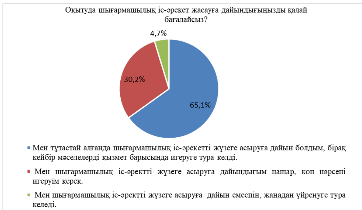
Сурет 2. Мұғалімдердің оқытуда шығармашылық іс-әрекет жасауға дайындық дәрежесі

Сауалнама нәтижелері респонденттердің 65,1% шығармашылық іс-әрекетті жүргізуге дайынмын, бірақ кейбір нәрселерді қызмет барысында игеруге тура келеді деп санайды; 30,2% - дайындықтың жеткіліксіздігін және көп нәрсені игеру керек десе, 4,7% - дайын еместігін көрсетеді (2-сурет). Басқаша айтқанда, сауалнама жүргізілген мұғалімдердің көпшілігі «жүре бара» көп нәрсені үйренуге тура келетінін, яғни шығармашылық іс-әрекетті жүзеге асыру үшін алдын ала арнайы әдістемелік дайындық қажеттілігі туралы айтады.