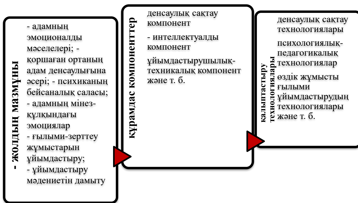
Сурет 2. Психологиялық - педагогикалық жағдай зияткерлік еңбек мәдениетін компоненттік қалыптастырудың негізі

Бұл принциптер белгілі бір психологиялық-педагогикалық жағдайларда жүзеге асырылуы мүмкін. Оларды қарастыру үшін белсенді қызмет пен жүйелі жұмыс арқылы зияткерлік еңбек мәдениетін қалыптастыру тәсілдерін анықтау және анықтау қажет, бұл толыққанды ұйымдастырылған қызмет процесінде оны иеленуге әкеледі (2-сурет).