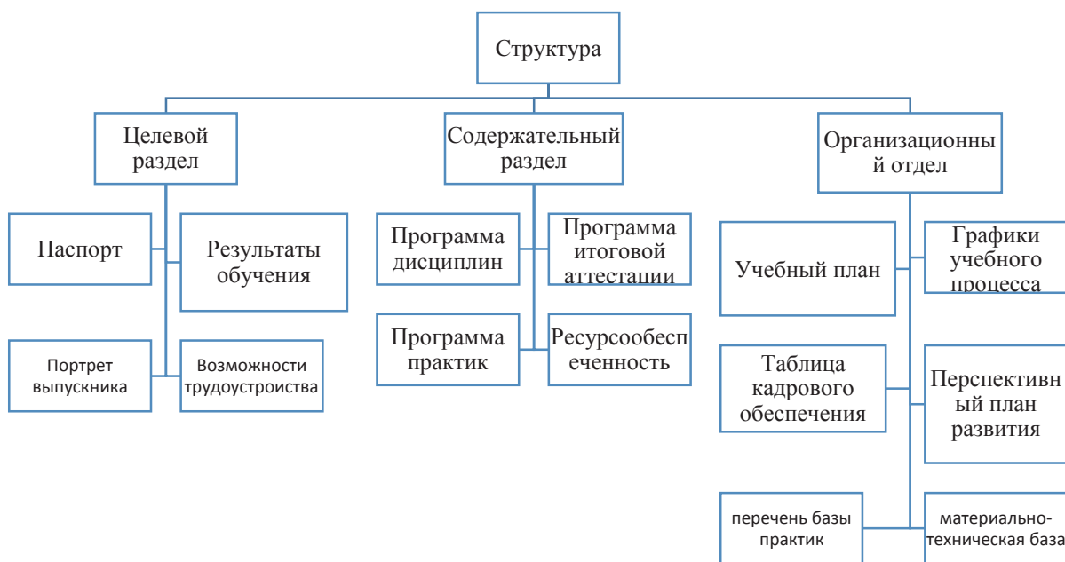
Рисунок 2. Структура образовательной программы

3 этап. Разработка образовательной программы. Проектирование основной образовательной программы целесообразно осуществлять в микрогруппах, которым требуется выдать задания на разработку единичных проектов – структурных элементов программы. Одновременно с определением единичных проектов формируется состав ответственных за их разработку и определяются сроки их выполнения. В зависимости от размера группы разработчиков и их готовности к работе возможны различные варианты формирования единичных проектов: выделение или, наоборот, объединение отдельных элементов необходимых изменений в образовательной системе.