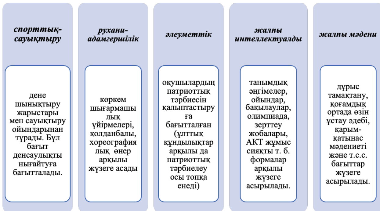
1-сурет. Сыныптан тыс жұмыстың бағыттары

Баланы дамыту іс-әрекеттеріне байланысты сыныптан тыс жұмыстың спорттық-сауықтыру, рухани-адамгершілік, әлеуметтік, жалпы интеллектуалды, жалпы мәдени бағыттары бар (1-сурет).